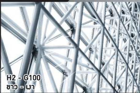
H2 - G100 ขาว - เมา

ทาตกแต่งบนพื้นผิวเหล็ก โดยเฉพาะเหล็กผิวมัน โครงสร้างเหล็กทุกชนิด แม้สภาวะรุนแรงชายทะเล ไม่ว่าจะเป็เหล็กชุบซิงค์ หรือเหล็กกัลวาไนซ์ สแตนเลส อลูมิเนียม อลูมิเนียมอัลลอยด์ ทั้งภายในและภายนอกอาคาร หรือตกแต่งสตีลคัลพท์