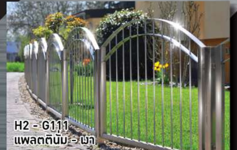
H2 - G111 แพลตตินัม - เมา