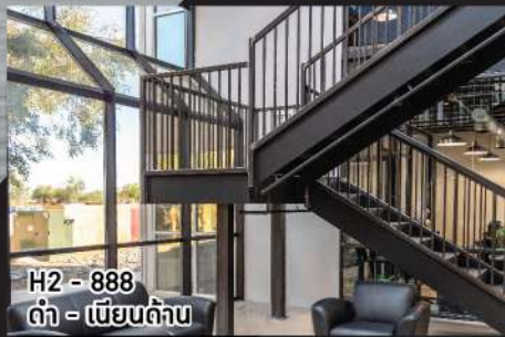
H2 - 888 ดำ - เนิบดัล